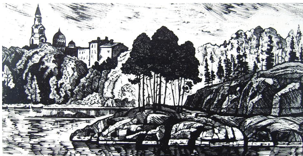
Рис. 4 / Fig. 4. «Ладожское озеро, Валаам» (худ. А. Авдышев) / “Lake Ladoga: Valaam” (art. A. Avdyshev)

Многие важные историко-культурные события связаны с этим водоёмом. Здесь, в северной части озера, в удалении от Новгородского и Московского центров, на острове возник Валаамский монастырь, со временем превратившийся в крупнейший религиозный и культурный центр Руси и России (рис. 4).