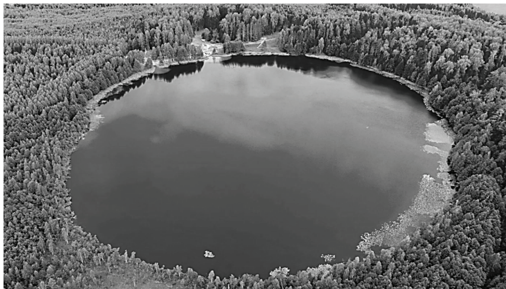
Рис. 3 / Fig. 3. Озеро Светлояр. Нижегородская область. Аэроснимок / Lake Svetloyar. Nizhny Novgorod region. Aerial photograph