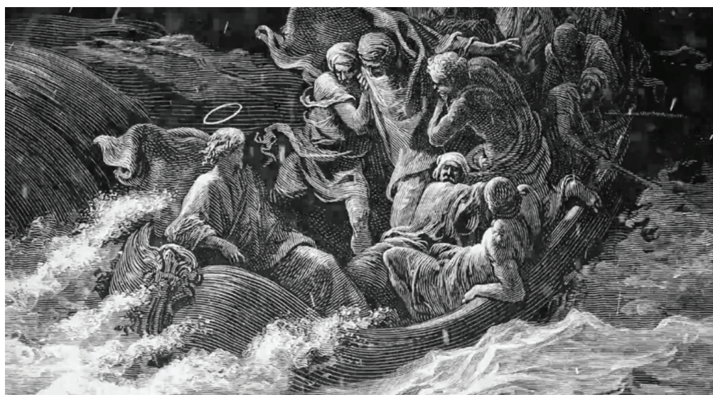
Рис. 2 / Fig. 2. Галилейское озеро: перед усмирением бури на Галилейском озере. Художник Густав Доре. Фрагмент / Lake of Galilee: Before the calming of the storm on the Lake of Galilee. Artist Gustav Dore. Fragment.

Материалами для данного исследования послужили многочисленные работы по географии и этнографии озёр. «Отталкиваясь» от работ по географии культуры [3; 4; 5; 6; 7; 13; 15], научных природных характеристик озёр [1; 2; 9; 10; 11; 12; 14], мы также рассмотрим и другие разнообразные сведения об историко-культурных событиях на озёрах, в т. ч. археологические данные,