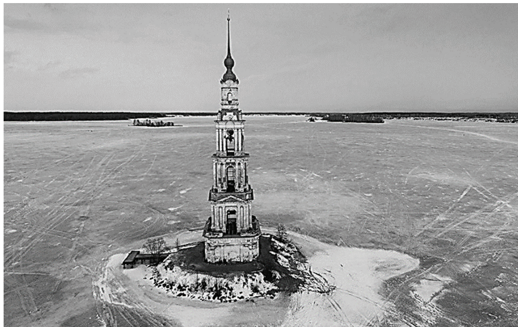
Рис. 5 / Fig. 5. Калязинская колокольня, полузатопленная в 1940 г. на Угличском водохранилище зимой / Kalyazin bell tower in the Uglich reservoir, half-flooded in 1940, in winter