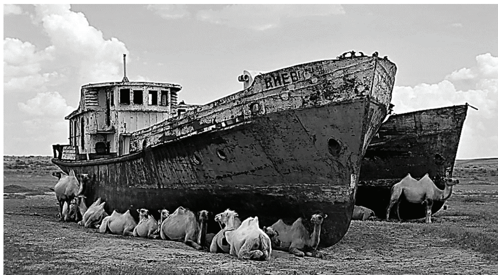
Рис. 6 / Fig. 6. Высохшее Аральское море-озеро / Dried Aral Sea