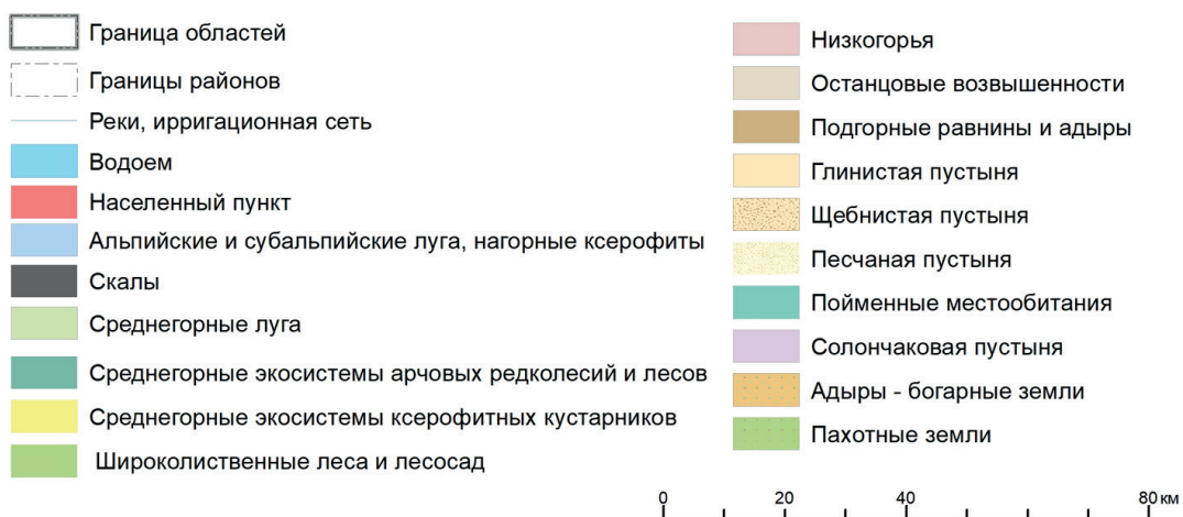
Рис. 3 / Fig. 3. Основные типы местообитаний Сырдарьинской и Джизакской областей / Main habitat types of Syrdarya and Jizzak regions