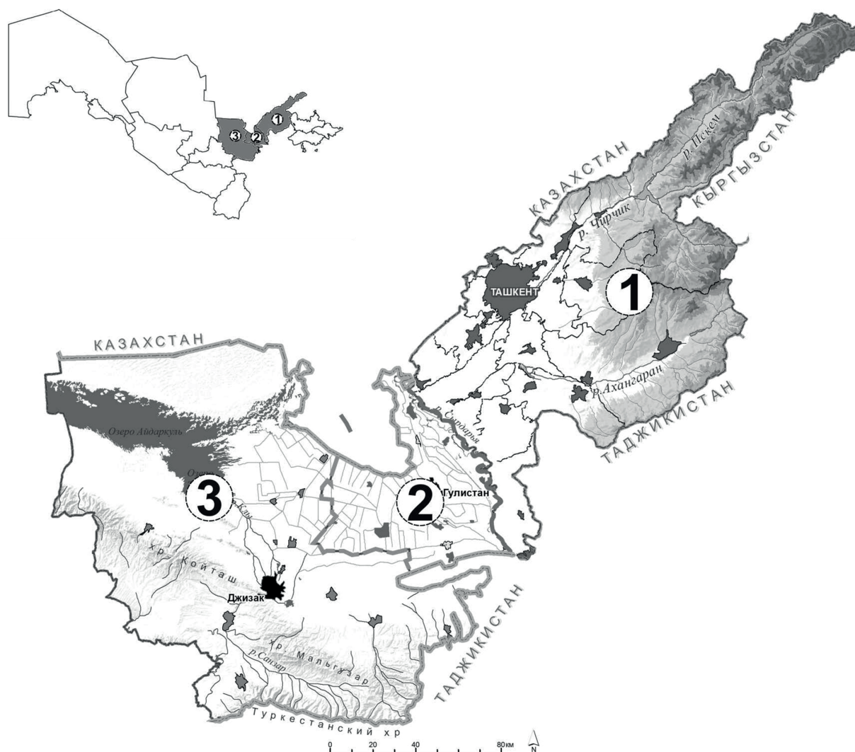
Рис. 1 / Fig. 1. Территория исследований – Ташкентская (1), Сырдарьинская (2) и Джизакская (3) области восточной части Узбекистана / Study area – Tashkent (1), Syrdarya (2) and Jizzak (3) regions of the eastern part of Uzbekistan